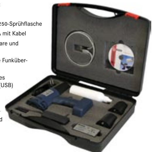
Foto: Koffer mit Extras